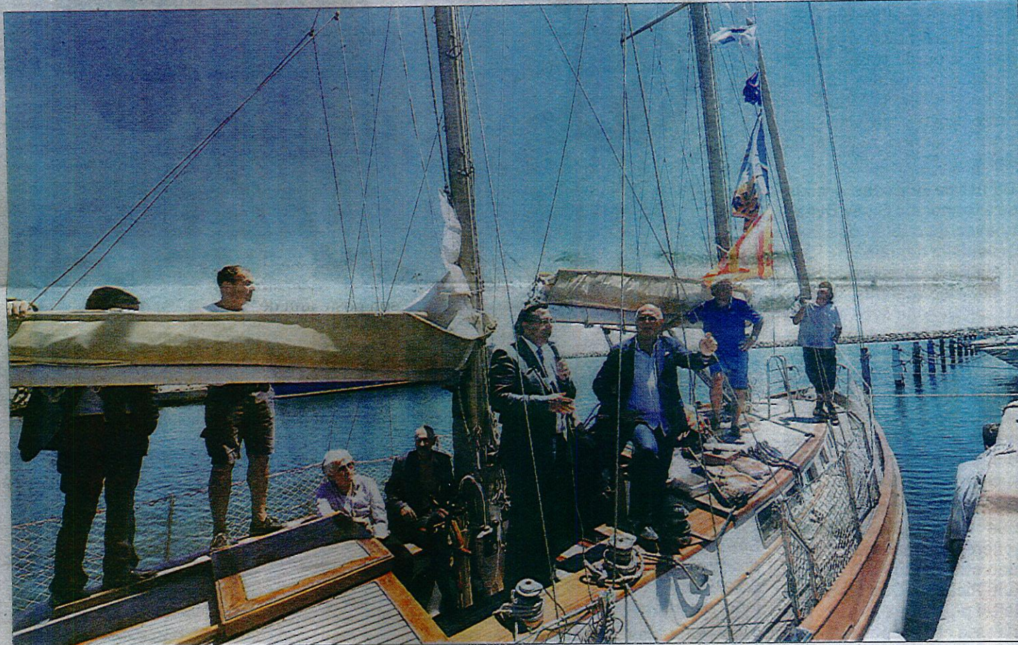
► ODYSSEA 8 : les responsables et les élus des ports de la côte se sont retrouvés pour débattre et signer une convention de coopération européenne en direction des plaisanciers.