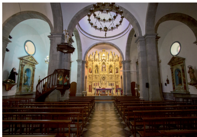
② Interior con Altar Mayor

En el s. XIX en Gran Canaria el Neoclásico es el lenguaje que impone definitivamente el aire renovador a la arquitectura dando paso al ecléctico, del que tenemos un claro ejemplo en el estilo arquitectónico de la Iglesia de San Vicente Ferrer, dentro de una línea clásica influenciada por elementos románticos como son los adornos básicos en la fachada, coronaciones piramidales, medallones.