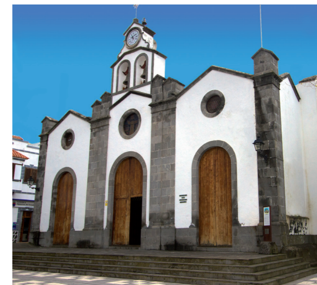
① Planta Basílica de tres naves abovedadas

① El templo de planta basílica se encuentra dividido en tres naves abovedadas, de fábrica sencilla en estilo ecléctico, erigido según el proyecto de Laureano Arroyo de Velasco en 1887. Con tres puertas en su frontis, en mampostería gris, rematadas en arcos de medio punto, coronados con tres ojos de buey, también estos en cantería, de los que recibe iluminación el coro en la primera planta; dicho frontis está dividido en tres cuerpos separados por pilares de cantería vista coronados en puntas piramidales, el cuerpo central se