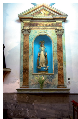
⑥ Virgen de la Milagrosa