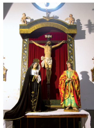
④ Escenificación del Calvario

Ya en el interior de la iglesia nos encontramos con una nave central o principal, separada de las laterales por arcos en cantería vista, la nave central termina en el ② Altar Mayor; en la nave izquierda encontramos ④ la escenificación del Calvario con un retablo que porta las imágenes de la Dolorosa, el Crucificado y San Juan; dicho retablo fue construido en Las Palmas por Agustín Navarro; continuando el recorrido encontramos otras dos imágenes sobre ménsulas ⑤ San Antonio de Padua y Santa Rita de Casia. Prosiguiendo por la nave izquierda localizamos ⑥ el Retablo de Ntra. Sra. la Virgen Milagrosa y al fondo ③ el retablo del Sagrado Corazón de Jesús. Atravesando el crucero donde está situado ⑧ el Púlpito, coronado este por la alegoría de la Fe y en su parte inferior por una paloma, el púlpito está decorado con cuatro relieves en los que están representados los cuatro evangelistas; ⑨ el Retablo Mayor situado en el Altar Mayor es un retablo de estilo ecléctico dominado por el neogótico isabelino, realizado por Manuel Pérez y Juan Leandro Pérez, consta de banco decorado con arcos que albergan relieves de los cuatro evangelistas y en el centro Cristo resucitado sobre dos soldados romanos; la predela dividida en tres calles y flanqueada por dos puertas a los extremos, en la