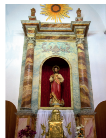
③ Sagrado Corazón de Jesús