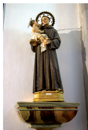
⑤ San Antonio de Padua

calle central una hornacina que contiene el sagrario de estilo neogótico y a ambos lados relieves en lo que se representan, de izquierda a derecha, San Pedro, San Andrés y Santiago el Mayor, todos ellos caracterizados con sus atributos individuales, al otro lado del sagrario Santiago el Menor, San Mateo y San Pablo. El cuerpo dividido en cinco calles, siendo las tres centrales hornacinas ojivales que albergan ⑩ las esculturas de San Vicente Ferrer, Ntra. Sra. de la Encarnación y San Blas; en los extremos laterales tiene dos relieves, en la izquierda se representa el “Noli me tangere” y en el extremo derecho La Oración en el Huerto, las cinco calles están adornadas con ménsulas policromadas en blanco y oro como toda la arquitectura del retablo; el ático está decorado con pináculos góticos a modo de remate de las calles.