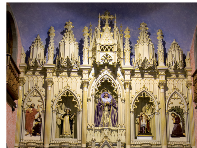
⑨ y ⑩ Retablo Mayor con las esculturas de S. Vicente Ferrer y Ntra. Sra. de la Encarnación

Ya en la nave de la epístola encontramos el retablo de la Ntra. Sra. del Carmen y el de San José, retablos gemelos de los nombrados anteriormente y realizados por la mismas manos que el retablo mayor, el de Ntra. Sra. de la Milagrosa y el del Sagrado Corazón de Jesús; todos ellos con esculturas portantes de busto redondo. La Pila Bautismal en cantería gris y sobre una ménsula la imagen de ⑦ Santa Lucía, y continuando el recorrido de la planta nos encontramos el Retablo de las Ánimas Benditas, que es el único en toda la iglesia con obra sobre lienzo, y en el coro localizamos ⑪ el Órgano, un instrumento alemán del s. XVIII, una de las joyas con que cuenta el templo, que fue construido en Hamburgo hacia la segunda mitad del siglo XVIII y llegó a nuestras islas gracias a importadores asentados en Tenerife. Tiene un frontispicio de los más hermosos entre