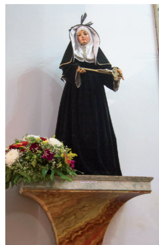
⑤ Sta. Rita de Casia

calle central una hornacina que contiene el sagrario de estilo neogótico y a ambos lados relieves en lo que se representan, de izquierda a derecha, San Pedro, San Andrés y Santiago el Mayor, todos ellos caracterizados con sus atributos individuales, al otro lado del sagrario Santiago el Menor, San Mateo y San Pablo. El cuerpo dividido en cinco calles, siendo las tres centrales hornacinas ojivales que albergan ⑩ las esculturas de San Vicente Ferrer, Ntra. Sra. de la Encarnación y San Blas; en los extremos laterales tiene dos relieves, en la izquierda se representa el “Noli me tangere” y en el extremo derecho La Oración en el Huerto, las cinco calles están adornadas con ménsulas policromadas en blanco y oro como toda la arquitectura del retablo; el ático está decorado con pináculos góticos a modo de remate de las calles.